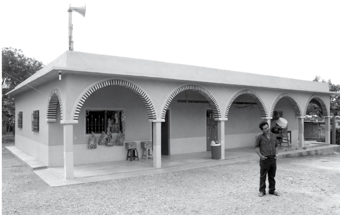
▶ La migración implica beneficios para los familiares que permanecen en el lugar de origen, como la inversión de las remesas en la renovación o construcción de viviendas. La Gloria, municipio de La Trinitaria, Chiapas, México, 2009.

El pueblo es el lugar en el que residen los recuerdos: la fiesta del pueblo, los domingos en familia o con amigos, el trabajo diario en el campo. Todo