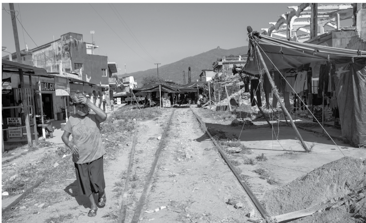
PROMETEO LUCERO ▶ La estructura de desigualdad del proceso migratorio da lugar a flujos de personas de países pobres hacia países ricos o desde economías muy empobrecidas hacia otras menos empobrecidas. Huixtla, municipio chiapaneco en el que se han asentado numerosas familias centro-americanas, diciembre de 2014.

Piven y Cloward (1977) hablan de la emergencia de un “nuevo sentimiento de eficacia”, que se produce en las personas que de ordinario se consideran políticamente impotentes y que a raíz de la experiencia de protesta comienzan a creer en su capacidad para cambiar las cosas. Ese empoderamiento de los implicados en el conflicto se manifiesta en cambios individuales y colectivos, en la esfera personal —empoderamiento psicológico— y en la política —empoderamiento político—. Respecto a la dimensión individual, quienes participaron en estas resistencias han visto crecer su autoestima, han superado el miedo a hablar en público o a actuar públicamente: